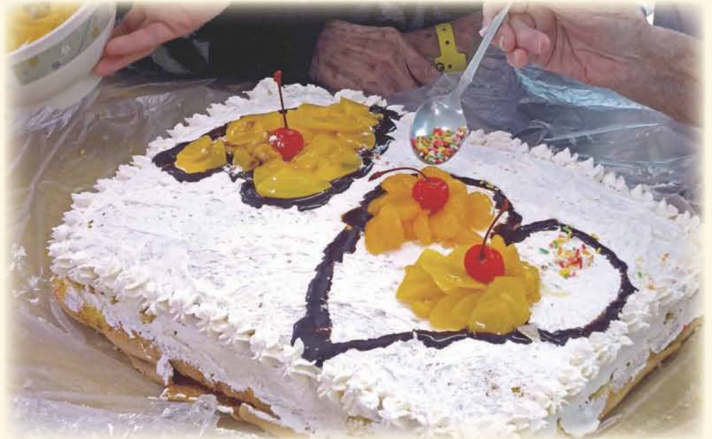
12月みんなでケーキのトッピングをしてみました。