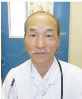
正信会 水戸病院 内科医師

最後に、除菌だけでなく、禁煙・減塩を心がけ、胃がん検診を受けることにより、胃がんによる死 亡率が低下する可能性が大いにあります。