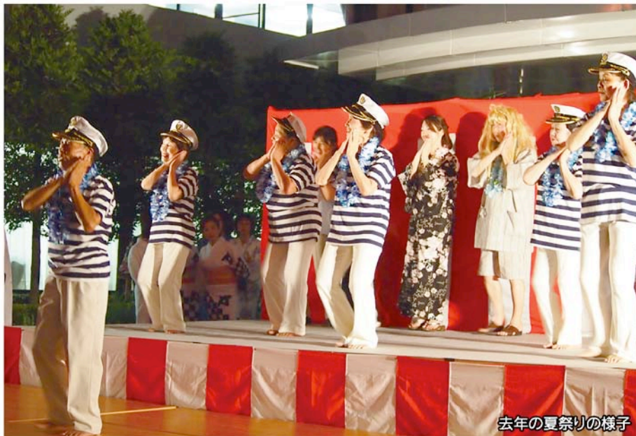
去年の夏祭りの様子