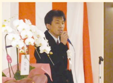
白橋斉病院長祝辞