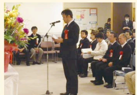
永年勤続表彰受賞者挨拶