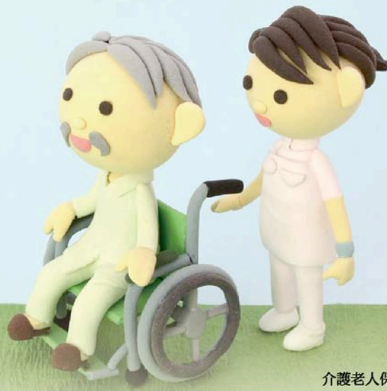
介護老人保健施設 ニューライフ須恵 療養部長