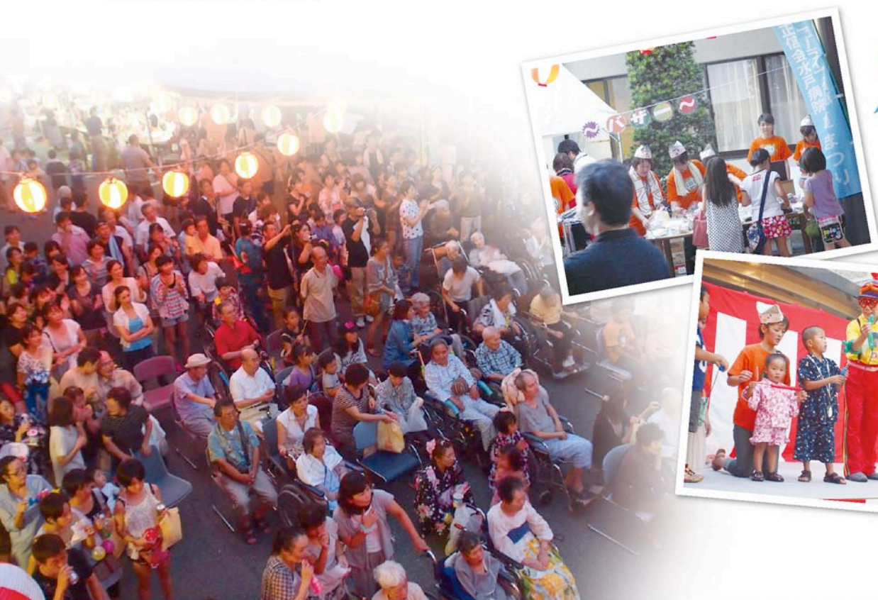
去年の夏祭りの様子

平成25年8月下旬の土曜日(予定)に正信会ふれあい夏祭りを開催致します。 今年も地域の方々と親睦を目的に夏祭りを盛り上げていきたいと思っておりますので、是非お立ち寄り下さい。