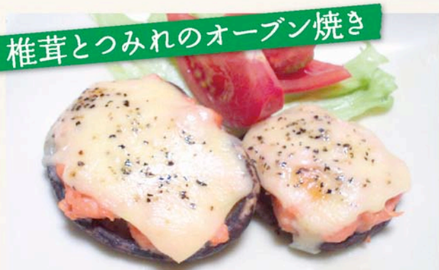
椎茸とつみれのオーブン焼き

作り方 ①つみれをしゅうまいの皮で包む ②蒸し器で10分蒸す(電子レンジのスチームモードでも可) ③器に盛って、ポン酢や辛子と一緒にどうぞ