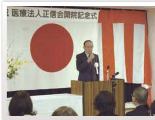
増田住博施設長挨拶