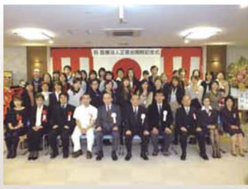
永年勤続表彰受賞者

これからも職員一同地域のため、医 療や保健・介護サービスを提供してま いります。