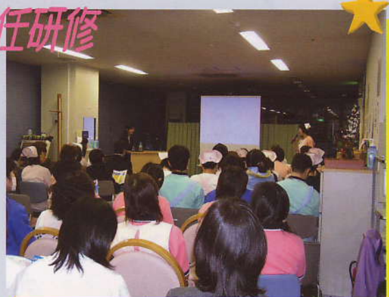
外部講師を招いての現任研修風景です