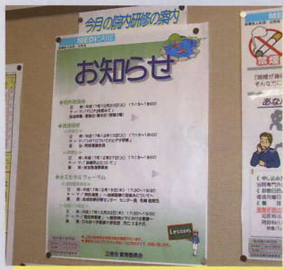
職員向けの院内研修の案内ポスター

教育という言葉を広辞苑で引くと「人に他から意図をもって働きかけ、望ましい姿に変化させ、価値を実現する活動。」と書いてあります。ちょっとカタイですか??「他から意図をもって…」というのも少し嫌な感じがします。また、「勉強」という言葉も、勉める・強いる…。中高生の頃、親からいつも「勉強せんねっ!!」が思い出されますねえ。しかし、言われたら余計に勉強しませんよね。